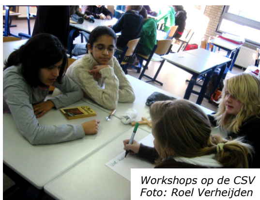
Workshops op de CSV

Het IVC vond het belangrijk dat de vrouwen in contact kwamen met hun Veenendaalse omgeving en met de lokale cultuur. Voor de school was doorslaggevend dat het project direct inpasbaar was binnen hun jaarlijkse Veenendaal-project voor de brugklas en zo aantoonbaar bijdroeg aan de onderwijsdoelen. Natuurlijk was de mogelijkheid om iets van jezelf te kunnen laten zien in het museum ook een motivatie om mee te doen voor de school en de leerlingen. Voor de vrouwen van het IVC gold dit veel minder, zij waren aanvankelijk juist heel terughoudend om naar buiten te treden. Dat veranderde gaandeweg, uiteindelijk waren ze trots om hun bijdragen in de tentoonstelling te zien. Het moeizame verloop van de samenwerking met de bekende Veenendalers is deels te verklaren uit het gebrek aan belang dat zij zelf hadden bij het project. Zij waren hierdoor minder gemotiveerd om mee te doen.