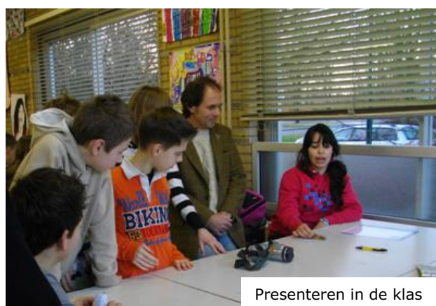
Presenteren in de klas

De ervaringen met de workshops zijn overwegend positief. De leerlingen deden actief mee met de opdrachten in de workshop en het lukte goed om hen met voorwerpen te laten werken. De vraag om een voorwerp te verzamelen bleef voor enkele leerlingen te abstract, maar dankzij de alertheid van de begeleidende docenten kwam dit meestal nog op zijn pootjes terecht. Opvallend was dat het moeilijk was om het criterium 'voorwerp van de laatste 50 jaar' duidelijk te maken. Het begrip museum werd zo onvermijdelijk geassocieerd met 'oud', dat zelfs sommige docenten bleven denken in echt oude dingen, in plaats van voorwerpen van gisteren. Zo belandde uiteindelijk enkele echt antieke gebruiksvoorwerpen in de schooltentoonstelling. Maar de meeste voldeden wel aan het 50 jaar-criterium. Lang niet alle leerlingen hadden ook daadwerkelijk een foto gemaakt van de eigenaar van het voorwerp met zijn/haar voorwerp, zoals in de instructie gevraagd was.