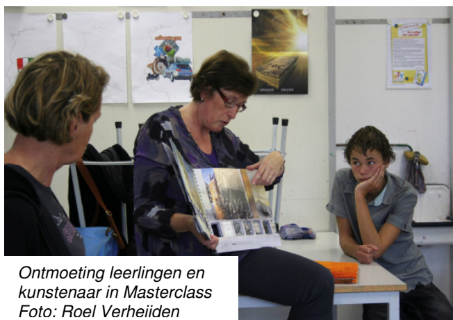
Ontmoeting leerlingen en kunstenaar in Masterclass

De amateurkunstenaars zijn persoonlijk benaderd via het netwerk van ZIMIHC. Zij gingen, geïnspireerd door de tentoonstelling 'Bewaar wat?!', zelfstandig aan de slag. Tijdens het werkproces zijn de kunstenaars regelmatig bezocht door de artistieke leider van 'Bewaar wat?! Kunstzinnig', om samen te reflecteren op het werk. Tevens zijn de kunstenaars gekoppeld aan leerlingen die in dezelfde kunstdiscipline werkten. Enkele kunstenaars hebben een masterclass aan de leerlingen gegeven over een bepaald onderwerp of specifieke techniek. Deze