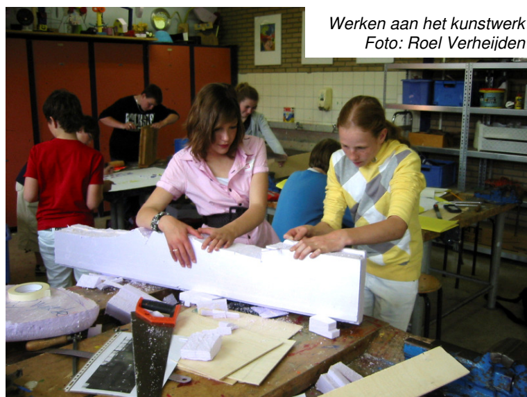
Werken aan het kunstwerk

Tijd is bij dit soort projecten de centrale factor. Het opbouwen van een nieuw netwerk kost véél tijd en geduld. De kleinere en grotere mentaliteitsveranderingen, die het gevolg zijn van het samenwerken met nieuwe partners, nemen echter aanzienlijk meer tijd. De doelstellingen van projecten als Bewaar wat?! wekken vaak hoge verwachtingen bij betrokken partijen en stakeholders. Maar de looptijd van de projecten zijn veel te kort om redelijkerwijs lange termijn effecten op attitude te kunnen meten. Kortom: enig 'verwachtingenmanagement' is nodig! Het is een kunst om verwachtingen van betrokkenen en stakeholders realistisch te houden, want diversiteitsdenken kost tijd. Bovendien werkt het in dit soort projecten vaak als volgt: twee stappen vooruit - maar daarna zakt de aandacht weer in, dus één stap terug = netto toch een stap vooruit!