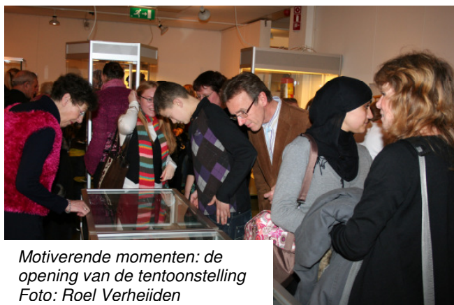
Motiverende momenten: de opening van de tentoonstelling

Het proces van de vrouwen van het Inter-cultureel Vrouwencentrum (IVC) verliep duidelijk stroever. Uiteindelijk wilden vier vrouwen van het IVC wel meedoen aan het vervolgtraject. Het bleek al snel dat er geen tot weinig kunstzinnige ervaring in de groep aanwezig was. De artistiek leider heeft daarom met de vrouwen besloten samen het proces op te starten. In een workshop Hoe kom je van voorwerp naar kunstwerk? zijn de vrouwen stap voor stap meegenomen in het creatieve proces. Enthousiast ging de groep uiteen met een duidelijke opdracht voor de tweede bijeenkomst. Helaas kon de tweede bijeenkomst pas na de zomervakantie plaatsvinden, wat duidelijk zijn invloed heeft gehad op het proces. Op de tweede bijeenkomst bleken twee vrouwen te hebben afgehaakt en had één vrouw tijdens de vakantie iets laten maken in Marokko. De vraag was in hoeverre het haar eigen kunstzinnige proces is geweest? Daarna heeft zij zelf nog iets toegevoegd aan het ontwerp en het op die manier een persoonlijke touch gegeven. De vierde vrouw had besloten haar gehandicapte broer te begeleiden in het creatieve proces. Uiteindelijk heeft zij ook haar moeder en een andere broer erbij betrokken. Dit heeft drie extra kunstwerken opgeleverd. Een creatief proces is voor deze doelgroep niet vanzelfsprekend en behoeft extra aandacht en begeleiding.