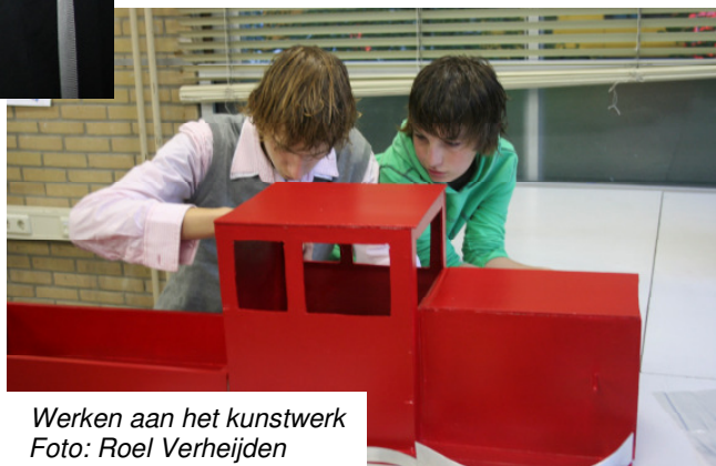
Werken aan het kunstwerk