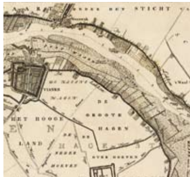
NATIONAAL ARCHIEF: KAARTEN ZUID-HOLLAND (DETAIL) P. 228 AD VAN BEMMEL