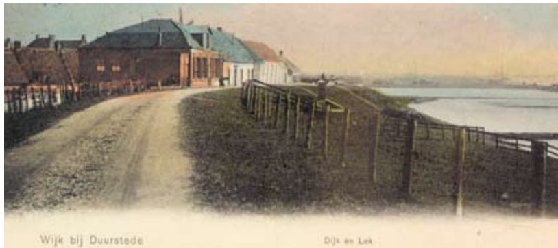
Wijk bij Duurstede